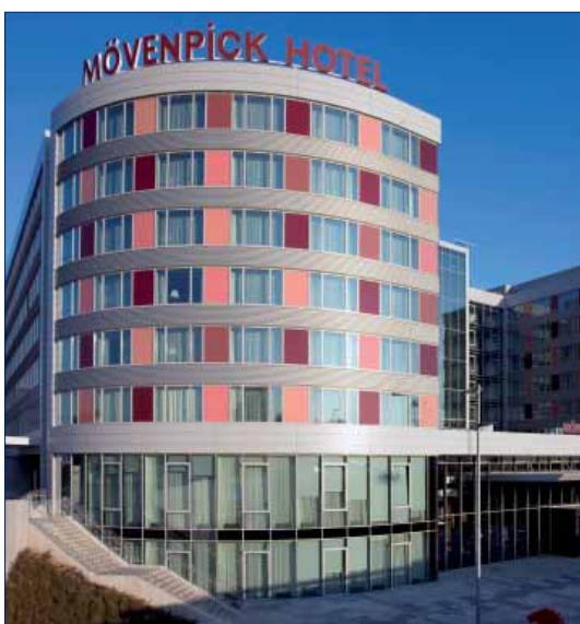
Hotel Mövenpick, Stuttgart Airport, Germany