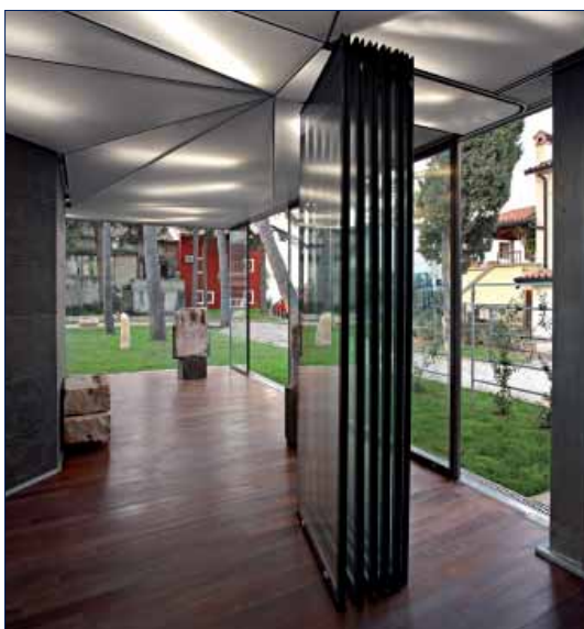
Pavillon Lapidarij Novigrad, Istra, Croatia