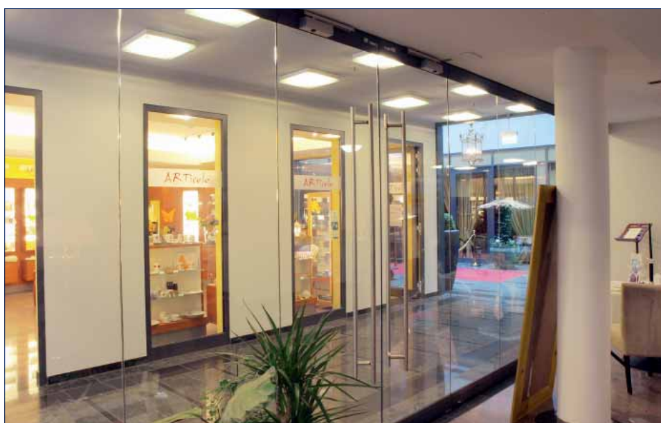
Carré an der Frauenkirche, Dresden, Germany