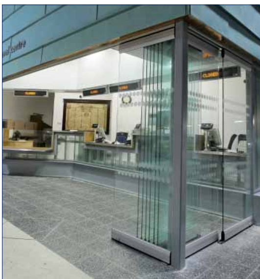
Chester Station, Cheshire, England / UK