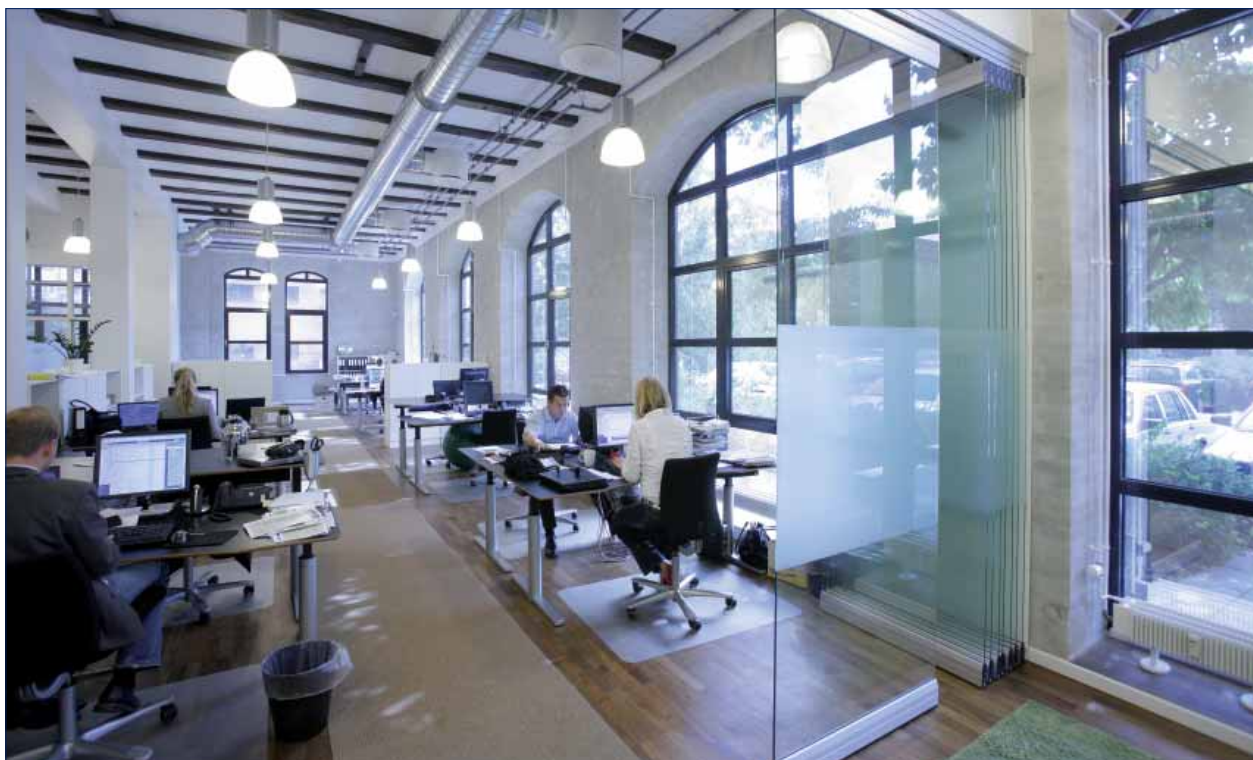
Multimedia House, Frederiksberg, Denmark