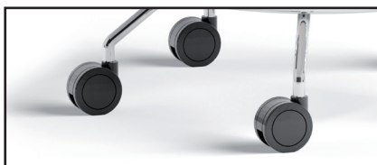
Ruedas de doble rodadura.