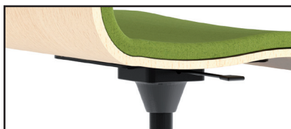
Mecanismo de regulación a gas.