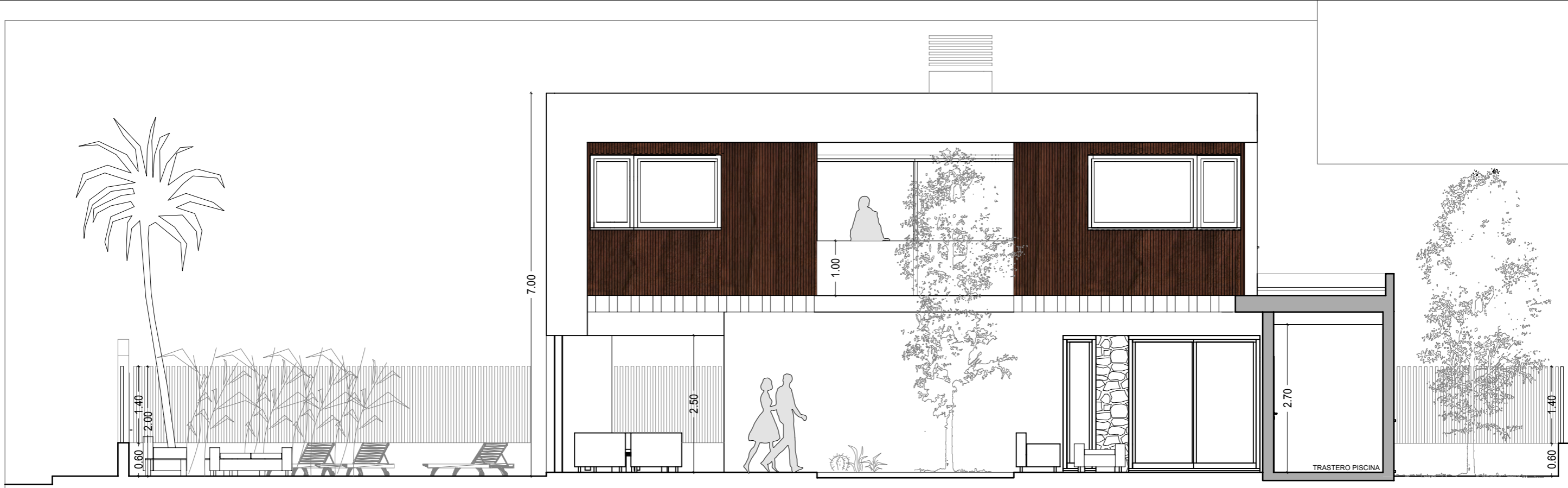
ALZADO ESTE (CALLE INTERIOR URBANIZACION)